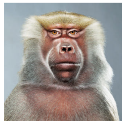
Tiere wie wir