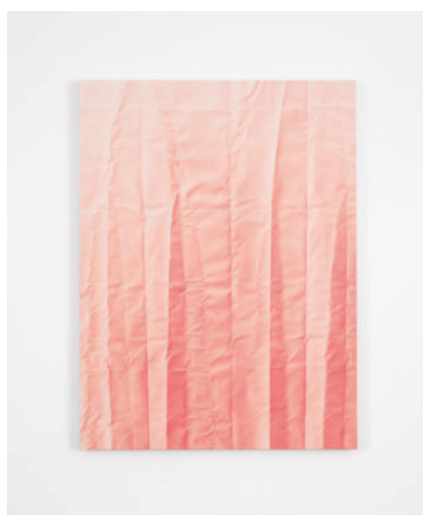
Hauchzart – wie eine sanfte Berührung