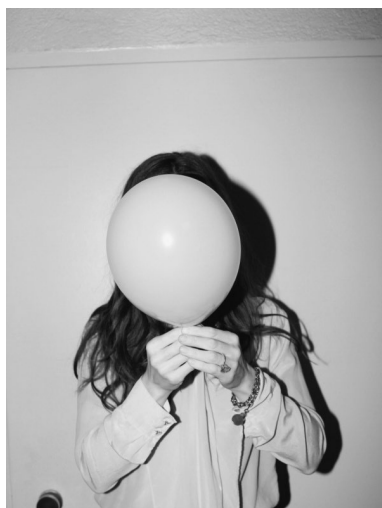
Fühlt sich so Entfremdung an?