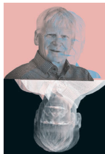
Religionsphilosoph Ingolf U. Dalferth